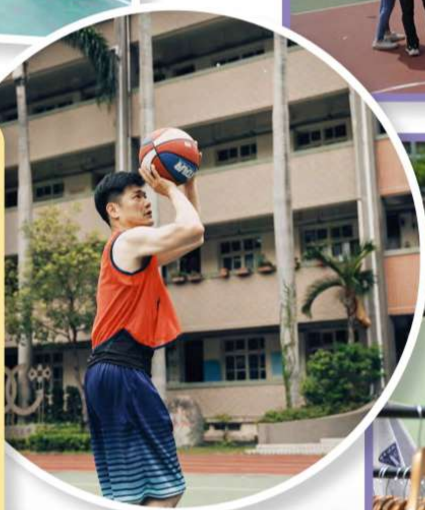
校友投籃大賽，學長們紛紛拿出看家本領