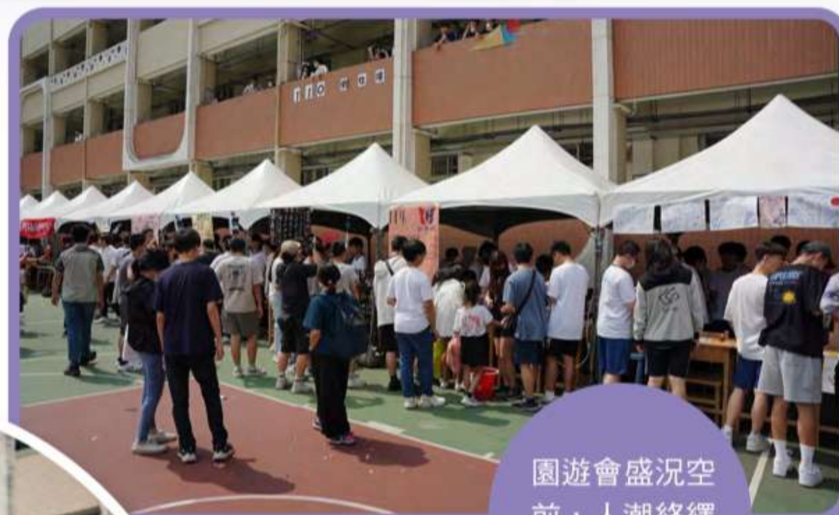
園遊會盛況空前，人潮絡繹不絕