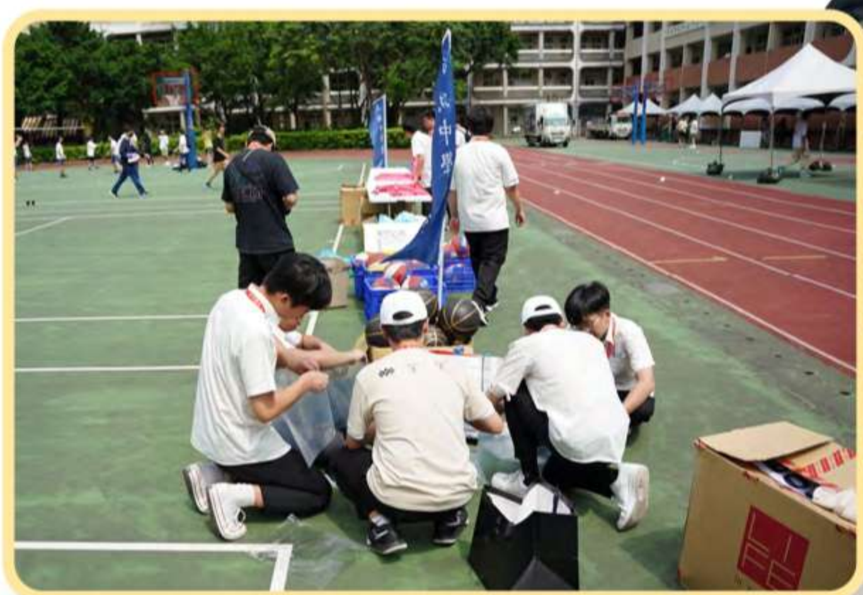
校友會工作人員布置投籃大賽