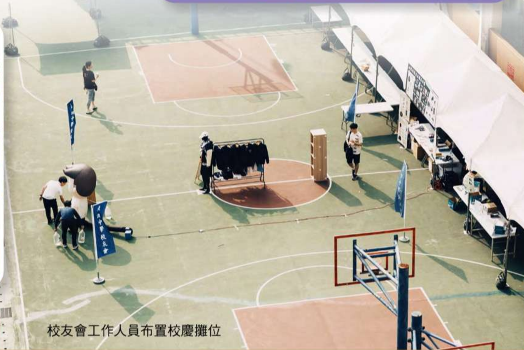
校友會工作人員布置校慶攤位