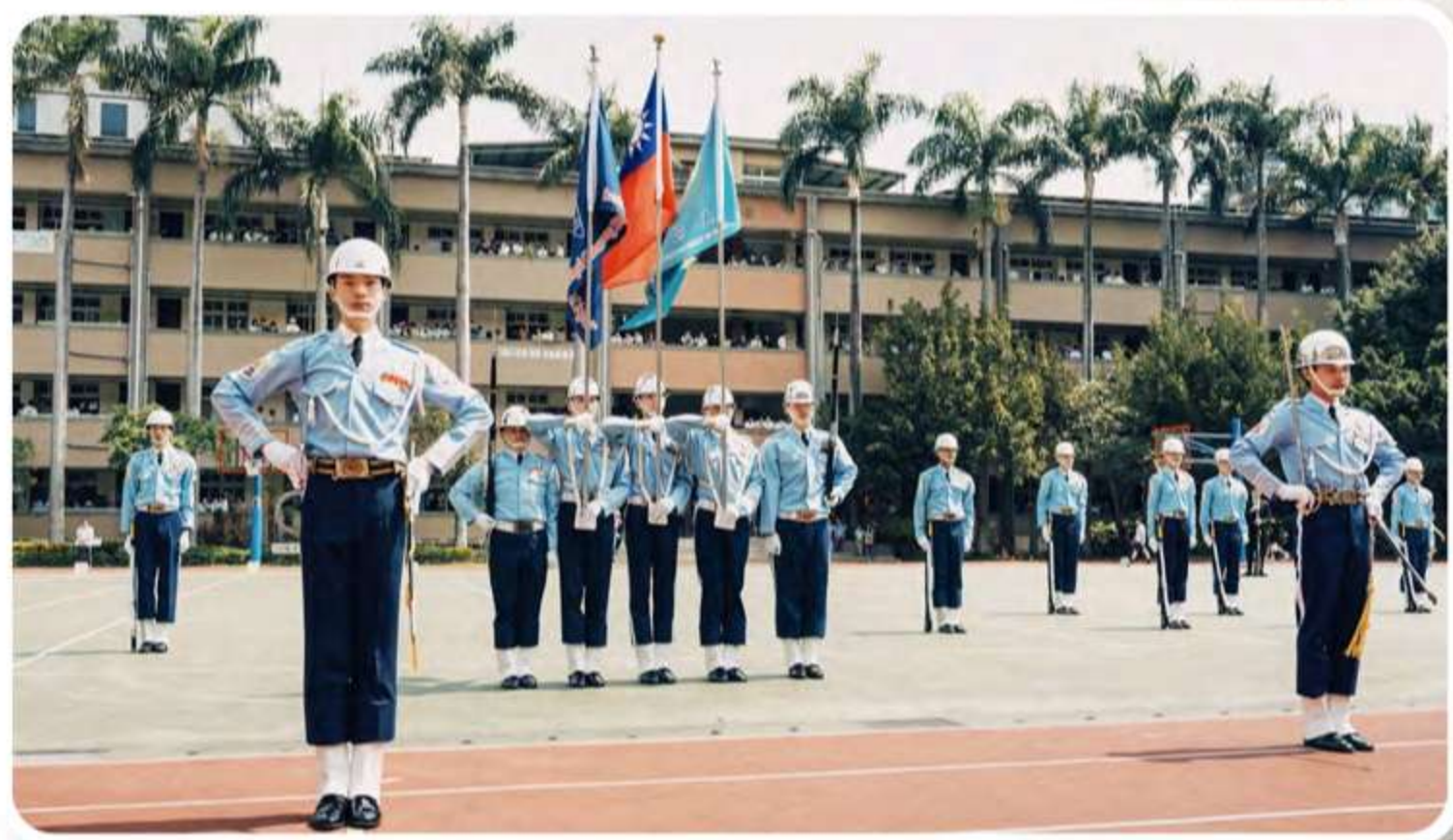
成功儀隊帶來氣勢磅礴的表演