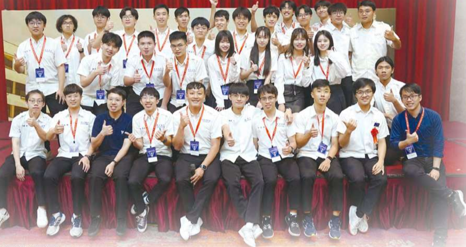
校友會志工圓滿完成本日晚會