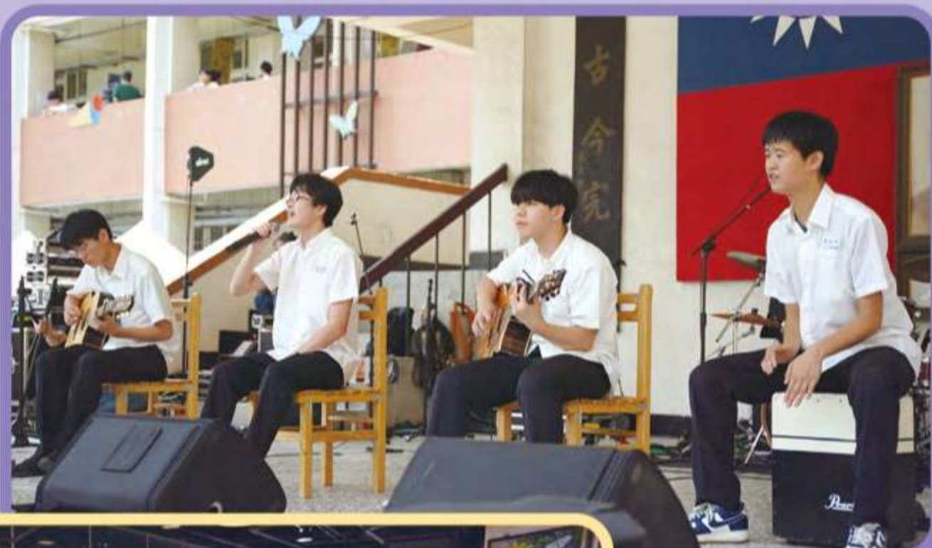
成功高中學生在司令台為校慶帶來精彩演出