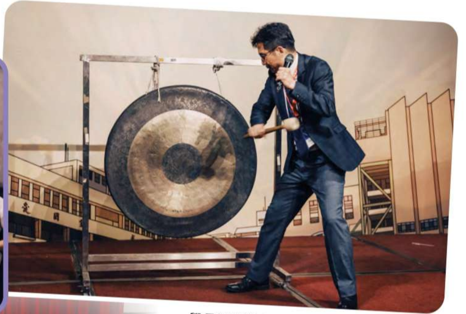
學長們踴躍支持成功樓計畫，踴躍捐輸