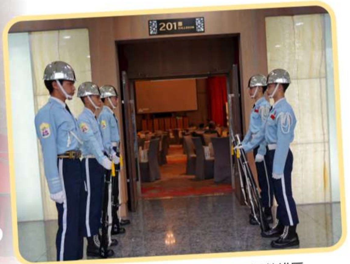
儀隊同學於入口站定隊形，氣勢雄厚