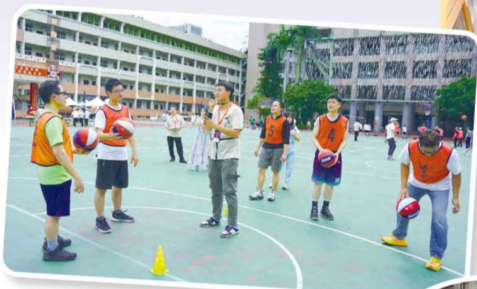
成功校友投籃大賽規則講解